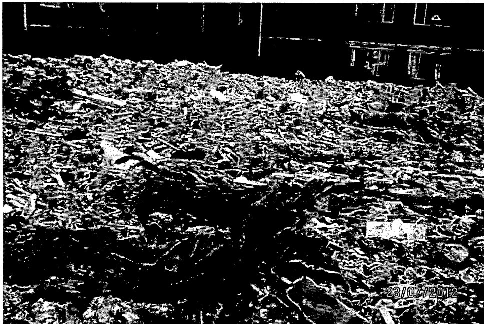
Foto 8. Panorámica del predio.