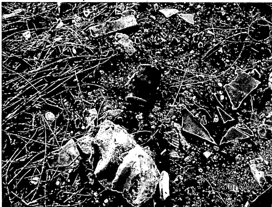
Foto 9. Residuos Peligrosos dispuestos en el predio