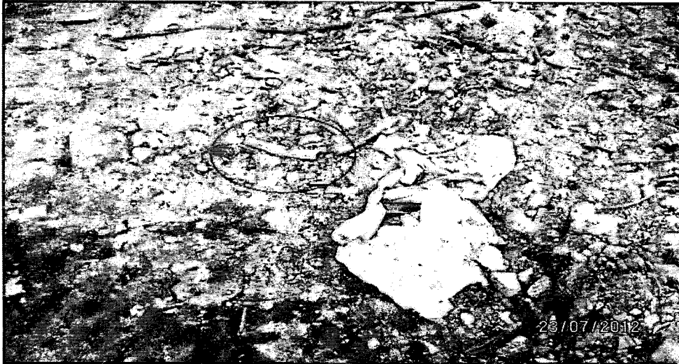
Foto 4. Residuos Ordinarios mezclados con escombros