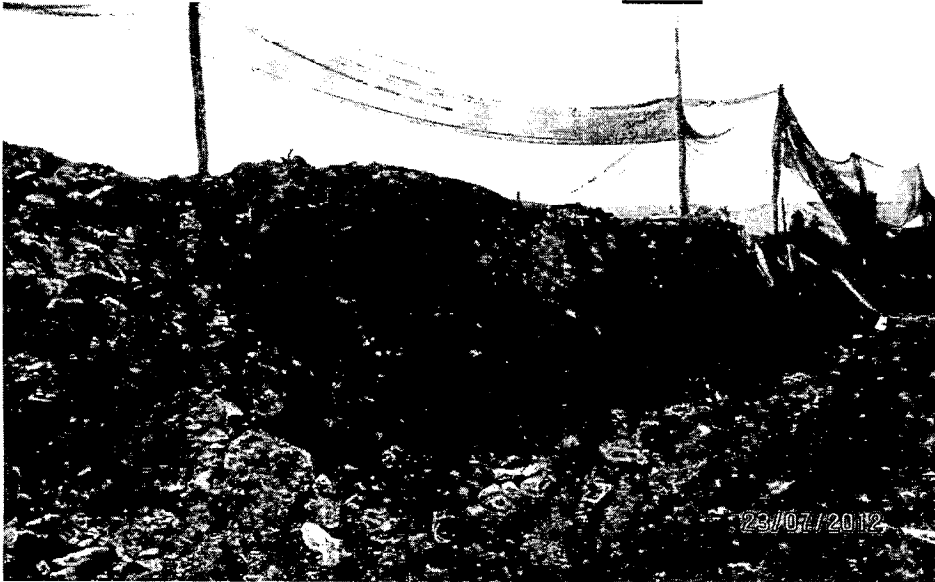
Foto 11. Altura del relleno alcanzado actualmente

Este predio además de ser utilizado como una escombrera ilegal, no cuenta con las condiciones técnicas y ambientales necesarias para permitir el ingreso de estos residuos ni para controlar, prevenir y/o mitigar los impactos ambientales negativos observados, los cuales obedecen principalmente al tratamiento inadecuado de los residuos encontrados.