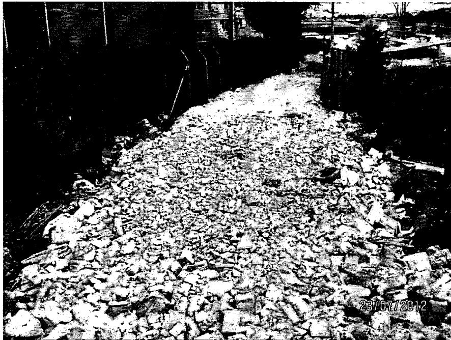
Foto 11. Carreteable por donde al parecer ingresan las volquetas que contienen los escombros. Nótese los escombros dispuestos para el acondicionamiento de esta vía de acceso.