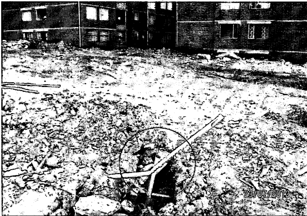
Foto 5. Residuos de PVC (Poli Cloruro de Vinilo) mezclados con escombros