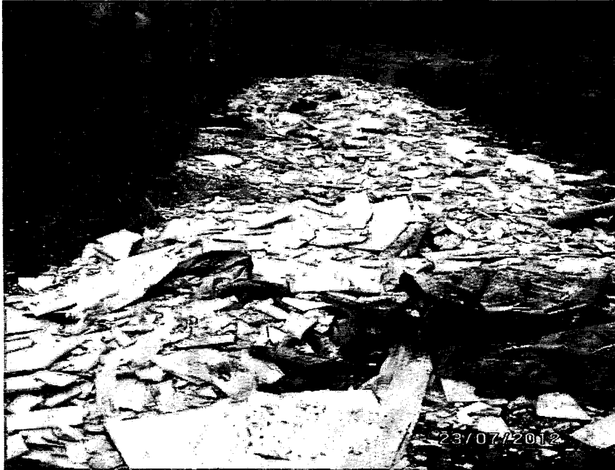
Foto 10. Escombros dispuestos y mezclados con bolsas de polietileno