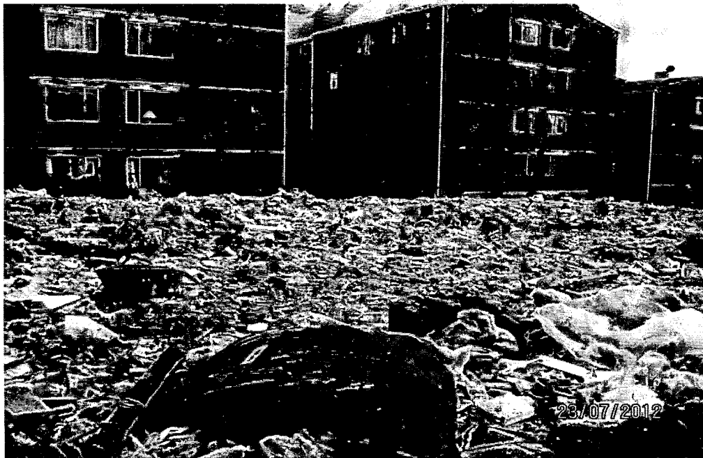
Foto 3. Conjunto Residencial Mirador de Suba (Al fondo) – Escombros y Residuos Sólidos Dispuestos (Finca Villa Ruth)