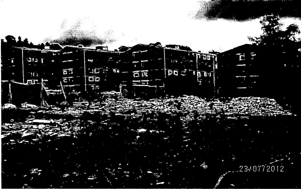
Foto 2. Panorámica del predio objeto de la queja.